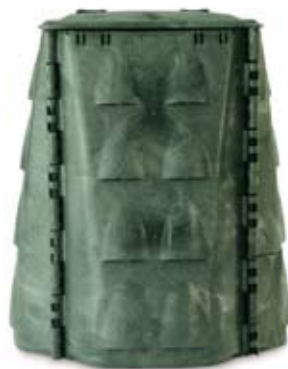
Compostador de varilla.