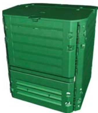
Compostador de pestaña.