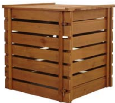
Compostador de listones.